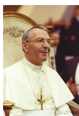
263° papa della Chiesa cattolica