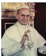
262° papa della Chiesa cattolica