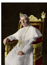
257° papa della Chiesa cattolica