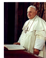
261° papa della Chiesa cattolica