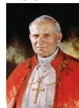
264° papa della Chiesa cattolica