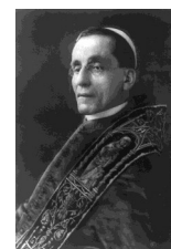
258° papa della Chiesa cattolica