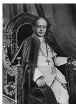
259° papa della Chiesa cattolica