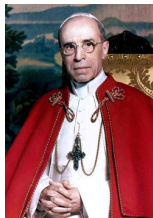
260° papa della Chiesa cattolica